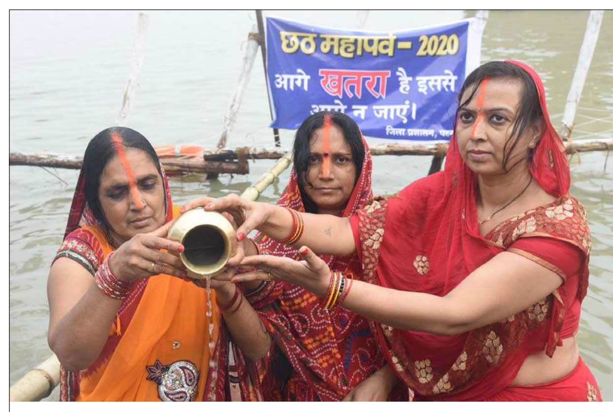
Devotees offer prayers to god Sun after taking bath in Ganga river on the occasion of Chhath festival in Patna.