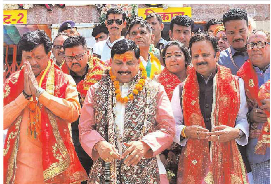
Madhya Pradesh Chief Minister Mohan Yadav comes out after offering prayers to Maa Sharda on the first day of Chaitra Navratri festival in Maihar, Satna district, Madhya Pradesh on Tuesday.

Note-counting machine gets tired and breaks down when they count this money. But Congress people are openly and shamelessly holding rallies seeking to stop action and proceedings against corrupt people," Modi alleged. "When Modi gives a guarantee of the country's security, they abuse me. When Modi fulfills the guarantee of abrogating Article 370 (which had granted a special status to Jammu and Kashmir), they start talking in the language of Pakistan," the prime minister said, adding that he is a devotee of Lord Mahakal and not afraid of anyone. "Modi bows either before Lord Mahakal or the public, and for the development of the country and its service, I have also learnt to tolerate abuse," he said. While accusing the opposition of abusing him for carrying out the consecration of Ayodhya's Ram temple, Modi alleged that the Congress conspired to defeat Droupadi Murmu when she was set to become the first tribal woman president of India.