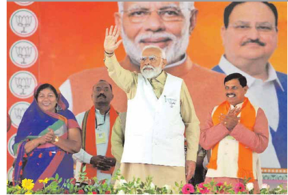
Prime Minister Narendra Modi with Madhya Pradesh Chief Minister Mohan Yadav during a rally ahead of the Lok Sabha elections in Balaghat, Madhya Pradesh on Tuesday.