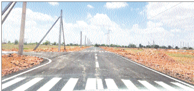
तिंवरी इंडस्ट्रीयल एरिया पर एक नजर

रीको की ओर से जोधपुर के तिंवरी पंचायत से करीब 2 किलोमीटर दूर स्थित बिजवाडिया रोड पर नया इंडस्ट्रीयल एरिया विकसित किया जाएगा, जिसमें प्रथम चरण में 235 भूखंडों को ई-ऑक्शन के माध्यम से बेचा जाएगा।