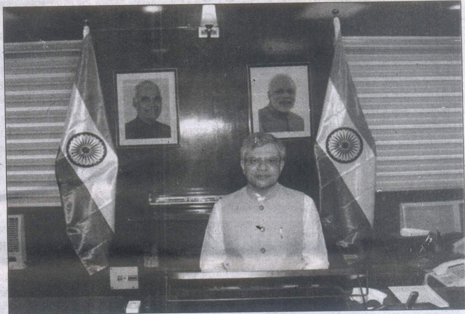
■ নিজের দফতরে নয়া রেলমন্ত্রী অশ্বিনী বৈষ্ণব। শুক্রবার

সুখবর ব্যুরো, নয়াদিল্লি : নিয়ম বদল হচ্ছে রেলমন্ত্রকে। এবার থেকে মন্ত্রকের আধিকারিকদের জন্য শিফট চালু হচ্ছে। নয়া রেলমন্ত্রী অশ্বিনী বৈষ্ণব রেল আধিকারিকদের ২টি শিফটে কাজ করার নির্দেশ দিয়েছেন। রেলমন্ত্রী নিজে তাঁর দফতরে রাত ১২টা পর্যন্ত কাজ করবেন। ফলে আধিকারিকদেরও কাজ করতে হবে। তাই মন্ত্রকের আধিকারিকদের ২টি শিফটে কাজ করার নির্দেশ দিয়েছেন তিনি। প্রথম শিফট সকাল ৭টা থেকে বিকেল ৪টে ও পরের শিফট দুপুর ৩টে থেকে মধ্যরাত পর্যন্ত। মন্ত্রীর এই নির্দেশে কর্মীদের মধ্যে অসন্তোষ দেখা দিয়েছে। পাশাপাশি, তাঁদের কাজের সময়সীমা নিয়ে প্রশ্ন উঠেছে। এছাড়াও, মধ্যরাত পর্যন্ত কাজ করে বাড়ি ফেরার ক্ষেত্রে তাঁদের নিরাপত্তা নিয়েও প্রশ্ন তুলছেন একাধিক আধিকারিক। সাধারণভাবে তথ্য প্রযুক্তি ক্ষেত্রে বা সাংবাদিকতার মতো পেশায় বিভিন্ন শিফটে কাজ করেন কর্মীরা। সরকারি কোনো দফতরে সেভাবে আলাদা শিফটে কাজ হয় না। আর সরকারি ক্ষেত্রে ৯ ঘণ্টাও কাজের সময়সীমা নয়। তাই রেলমন্ত্রীর নির্দেশে কর্মীদের মধ্যে অসন্তোষ দেখা দিয়েছে। তাঁদের বক্তব্য, রেলমন্ত্রকে মধ্যরাত পর্যন্ত