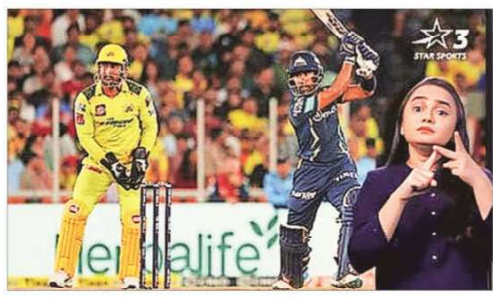
In a first for live sports broadcasting, Star Sports has added sign language interpretation to its IPL feed