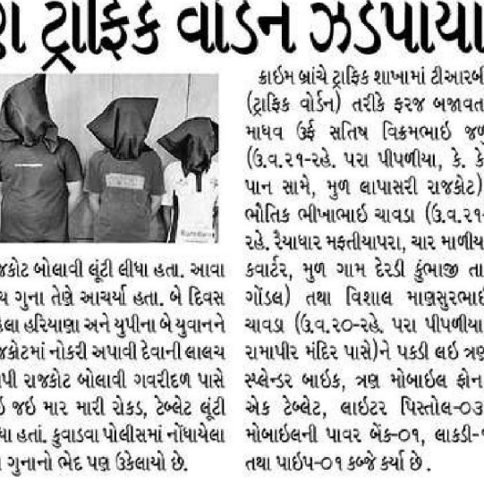
રાજકોટ બોલાવી લૂંટી લીધા હતા. આવા પાંચ ગુના તેજે આરંભ્યાં હતા. બે દિવસ પહેલાં હરિયાણા અને યુપીના બે મિત્રને રાજકોટમાં નોકરી અપાવી દેવાની લાલચ આપી રાજકોટ બોલાવી ગવરીદાઈ પાસે લઈ જઈ માર મારી રોકડ, ટેબલેટ લૂંટી લીધા હતાં. કુવાડવા પોલીસમાં નોંધાયેલા આ ગુનાનો ભેદ પણ ઉઠાવ્યો છે.

» હરિયાણા-યુપીના બે મિત્રને ફેસબુક ફ્રેન્ડ બનાવી નોકરી અપાવી દેવાની લાલચ દઈ લૂંટી લીધા હતા. નવગુજરાત સમય > રાજકોટ. રાજકોટમાં ત્રણ ટ્રાફિક વોર્ડન ટોલકી રીતે લૂંટ ચલાવતાં હોવાનું પુલકત ત્રણેયને ક્રાઈમ બ્રાન્ચે પકડી લીધા છે. આ ત્રણ પૈકી એક મુખ્ય સુત્રધાર જ્યારે વોર્ડન નહેતા ત્યારે સત્તા ભાવે પિસ્તોલ, રિવોલ્વર જેવા હથિયારો વેચવાના બહાને રાજસ્થાનના લોકોને