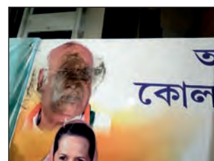
তদন্তকারীদের দাবি, ধৃতরা জেগায় স্কীকার করেছে যে, তারাই খাড়গের ছবিতে কালি লাগিয়েছিল।