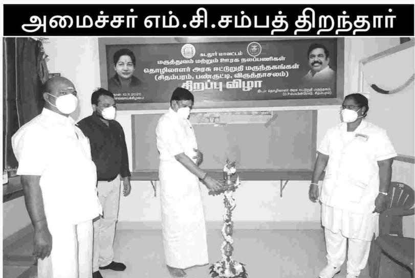
தொழிலாளர்கள் மற்றும் அவர்களின் குடும்பத்தினர்கள் பயன்பெற்று வருகின்றனர். இம்மாவட்டத்தில் இம்மாவட்டத்தில் சமார் ஒரு லட்சம் தொழிலாளர்கள் பயன்பெற்றுள்ளனர். தற்போது பண்டுட்டி, சிதம்பரம் மற்றும் விருத்தாச்சலம் பகுதியில் வசிக்கும் தொழிலாளர் அரசு ஈட்டுறுதி காப்பீட்டாளர்கள் இரத்தப் பரிசோதனை, ஸ்கேன், எக்ஸ்ரே போன்றவற்றிற்கு கடலூர் மாவட்ட அரசு மருத்துவமனைக்கு செல்ல வேண்டிய நிலை உள்ளது. இனிவருங்காலங்களில் பண்டுட்டி, விருத்தாச்சலம், சிதம்பரம் பகுதிகளிலே பரிசோதனைகள் செய்துகொள்ளலாம். இம்மருந்தகங்கள் தொடங்குவதன் மூலம் பண்டுட்டி பகுதியை சார்ந்த 3803 தொழிலாளர் அரசு ஈட்டுறுதி காப்பீட்டாளர்களும், சிதம்பரம் சூற்றுப்பட்டா பகுதியை சார்ந்த 3918 தொழிலாளர் அரசு ஈட்டுறுதி காப்பீட்டாளர்களும், சிதம்பரம் சூற்றுப்பட்டா பகுதியை சார்ந்த 3970 தொழிலாளர் அரசு ஈட்டுறுதி காப்பீட்டாளர்களும் பயன்படலாம். இவ்வாறு அவர் கூறினார்.