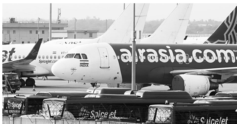
The airline owns 49 per cent of AirAsia India, a joint venture with Tata Sons

Group Chief Executive Officer Tony Fernandes told Reuters in September that the group intends to consolidate and strengthen its Asean foothold, which