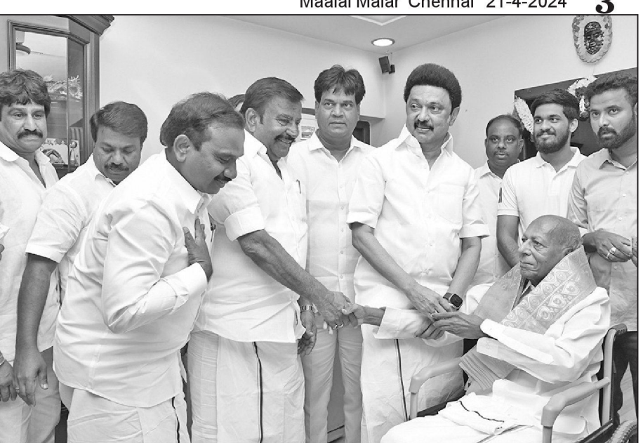
<mark>அற்காடு வீராசாமி பிறந்த நாள்</mark>

வருகிற 29 ந்தேதி தேரோட்டம் நடக்கிறது. மே தப்ப உற்சவம் நிகழ்ச்சி நடக்கிறது.