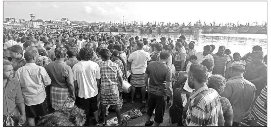
காசிமேடு மீன் மார்க்கெட்டில் மீன் வாங்க திரண்ட பொதுமக்கள். மீன்பிடி தடைகாலம் அமலில் இருப்பதால்