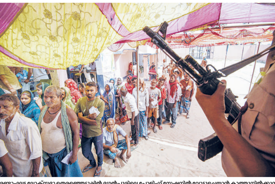
രണ്ടാംഘട്ട ലോക്സഭാ തിരഞ്ഞെടുപ്പിൽ ഗേൾപ്പുരിലെ വോളിംഗ് സ്റ്റേഷനിൽ വോട്ടുചെയ്യാൻ കാത്തുനിൽക്കുന്ന വോട്ടർമാർ.