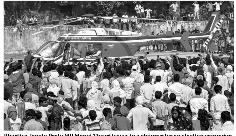
Bhartiya Janata Party MP Manoj Tiwari leaves in a chopper for an election campaign rally ahead of the Bihar Assembly polls, in Kaimur district

Piramal Group has bid for DHFL's Natrol business to an outstanding private 3.000 crore retail portfolio, offering just ₹6,000 crore, apart from ₹9,000 crore of the ₹12,000 crore available with the company. Piramal's offer would result in a recovery of only around 6 per cent for the lenders. Adani Group has bid for DHFL's wholesale and Slum Rehabilitation Authority (SRA) asset portfolio for ₹2,250 crore. Of this, ₹750 crore will be paid within a year and the balance ₹1,500 crore after eight years. The National Company Law Tribunal, meanwhile, extended the deadline to complete the bankruptcy process by 90 days, giving more time to the lenders to find a buyer. The bids for the company were muted also owing to a forensic audit report by Grant Thornton, which revealed a ₹14,500crore hole in DHFL's books. The report, which has been submitted to the National Company Law Tribunal (NCLT), has said there is a ₹9.320-crore hole in the wholesale books, a ₹1.707-crore loss on the SRA