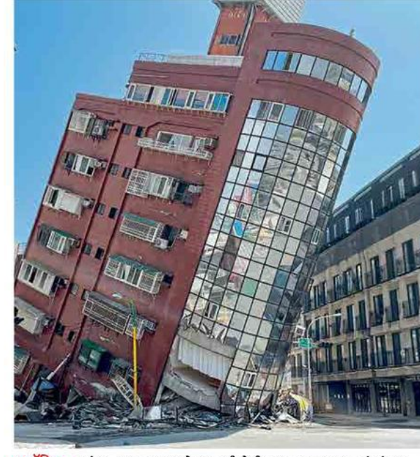
ह्युॲिलन : भूकंपाच्या धक्क्यामुळे बुधवारी येथील एक इमारत ४५ अंशांच्या

झाली. भूकंपाचा हादरा वीस ते तीस जाणवल्याचे स्थानिकांनी सांगितले. भुकंपामुळे किमान २४ ठिकाणी दरडी कोसळल्या तर ३५ रस्ते, पुल आणि बोगद्यांना तडे गेले. मोठी पडझड झाल्याने, तसेच अपघात