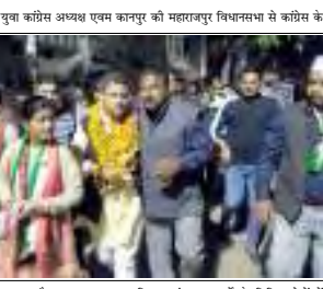
कानपुर सोमवार को उत्तर प्रदेश युवा कौशल अथवा एएम कानपुर की महाराजपुर विधानसभा से काँग्रेस के...