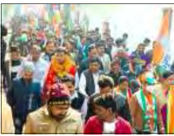
कानपुर जनसम्पर्क कार्यक्रम के अगले चरण में आज कितवई नगर विधानसभा के प्रयासों...