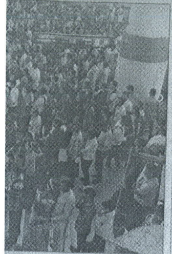
जुटी भारी भीड़।

सोमवार दोपहर हुई इमार्गम बारिश ने जहां एक ओर नोएडा के लोगों को गर्मी और उमस से राहत दी, वहीं वाहन चालकों के लिए दिक्कतें भी बढ़ा दीं। बारिश के कारण शहर के ज्यादातर पुराने सेक्टरों व ग्रामीण इलाकों के अलावा अंडरपास के नीचे भी जलभराव हो गया। बारिश की वजह से बंद हुई ट्रेफिक लाइटों ने भी लोगों को खासा परेशान किया। मुख्य मार्गों पर जाम से बचने के लिए लोगों ने आंतरिक सड़कों का इस्तेमाल करने की कोशिश की, लेकिन वहां भी उन्हें जाम से जुझना पड़ा। रक्षाबंधन की वजह से सोमवार को सड़कों पर निजी वाहनों की संख्या भी काफी ज्यादा थी। इससे सबसे ज्यादा दिक्कत बॉर्डर वाले इलाकों में हुई। दिल्ली से नोएडा और नोएडा से दिल्ली आने-जाने वाली ज्यादातर सड़कों पर शाम को भारी जाम लगा गया। एमपी-1, 2, 3 मार्गों के अलावा दादरी-सूरजपुर मार्ग पर भी वाहन चालक लंबे जाम में फंसे रहे।