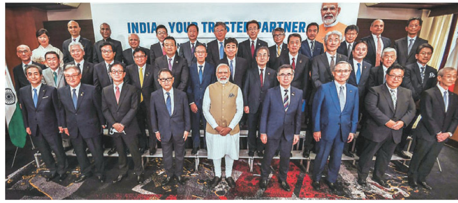
जापान में प्रमुख कंपनियों के 30 मुख्य कार्याधिकारियों से मुलाकात करते प्रधानमंत्री नरेंद्र मोदी

एक आधिकारिक बयान में कहा गया कि इन कंपनियों में वाहन, इलक्ट्रॉनिक्स, सेमीकंडक्टर, इस्पात, प्रौद्योगिकी, व्यापार तथा बैंकिंग और वित्त सहित विभिन्न क्षेत्रों का प्रतिनिधित्व था। प्रधानमंत्री ने इस बात पर जोर दिया कि भारत और जापान स्वाभाविक साझेदार हैं। उन्होंने भारत-जापान संबंधों की अपार संभावनाओं के ध्वजवाहक के रूप में कारोबारी समुदाय की सराहना की। उन्होंने याद किया कि