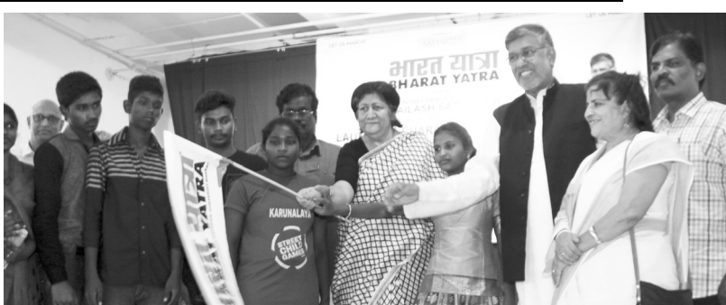
Nobel Peace Laureate Kailash Satyarthi participating in Bharat Yatra at Stella Maris College in Chennai today.

'The government does not bother about us. I was a child labourer and when I was selected for the world cup, I was not able to get a passport as I did not have any address. Now with the help of an NGO, I was able to get a passport. Because of their support I was able to participate in the world cup and now I'm studying Economics. To abolish child labour in India, the government should enforce compulsory education till the 12th standard. There are many people like me who have big dreams and we are not able to realise them because of society. It is people like us, who strug-