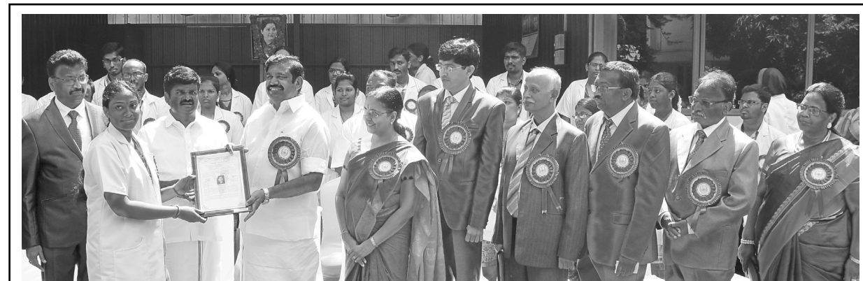
Chief Minister Edappadi K Palaniswami today gave 10 token appointment orders to the 1,013 assistant doctors, who were selected in the Tamilnadu Medical Entrance Exam, at his camp office in Chennai today. Speaking on the occasion, he said that the State is leading when it comes to the medical sector in the country and doctors should dedicate their life and serve the people in the rural areas and villages. State Health Minister C Vijayabaskar, Chief Secretary Girija Vaidyanathan, Health Secretary J Radhakrishnan were present.

Elango emphasised that 'I have almost fulfilled the power supply needs of my village and so my next initiative is making solar powered intra-village cycles. These cycles will be extremely affordable and one just needs to charge them to commute. Not only that, when charging stations are set up, the process will get even more refined. The greatest advantage of these solar solutions is that they are totally pollution-free.'