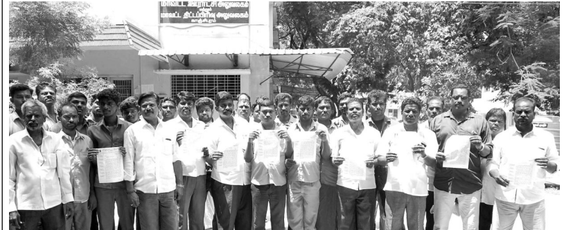
காஞ்சிபுரத்தில் வெளி மாவட்ட ஆட்டோக்கள் இயக்கப்படுவதை தடை செய்ய கோரி காஞ்சிபுரம் அறிஞர் அண்ணா - டாடா மேஜிக் உரிமையாளர் மற்றும் ஆட்டோ ஓட்டுனர்கள் சங்கம் சார்பில் மாவட்ட கலெக்டரை சந்தித்து மனு அளித்தனர்.