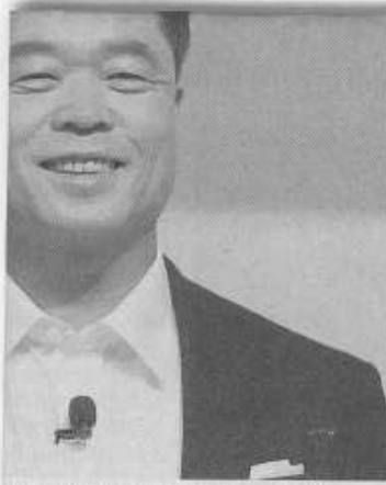
ing Southwest Asia, at the launch of the

bigger and better and added "Make for India" innovations that will transform lives yet again. Galaxy Note 8 lets people do things they never thought were possible."